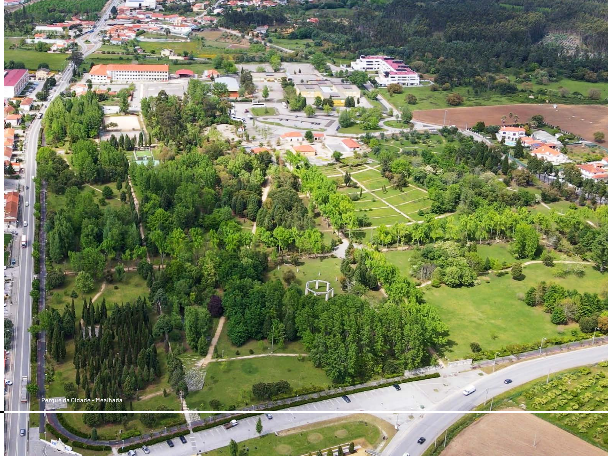
Parque da Cidade - Mealhada